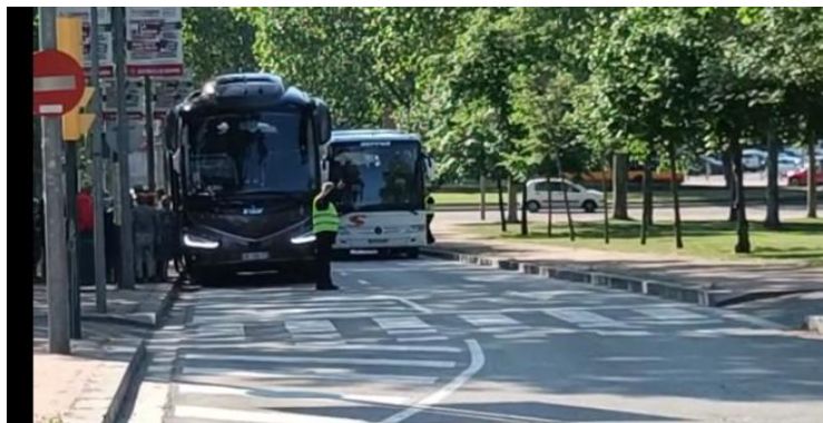
Fotografia esquerra membres de seguretat privada fent tasques de seguretat ciutadana, costat dret fent tasques de circulació viària i trànsit fent indicacions als vehicles.